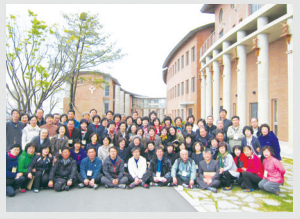
사제 부제 선물 협력