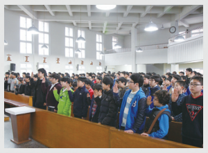
성소주일 행사 협조